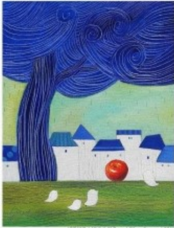
박홍미 / 40.3 X 31.8 cm / Oil on Canvas / 2016

꽃의 질감과 함께 추상적인 표현법이 가미된 나진기 화백의 작품은 차분하고, 정적이며, 미시적이고 잔잔한 느낌을 전해주는 부드럽고, 따뜻한 감성이 담긴 작품인 것이 특징 이다.