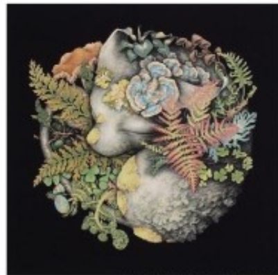
김바름 / 25.0 X 25.0 cm / 일지에 제작 / 2016

세세한 붓터치로 꼼꼼하게 표현해내는 이끼는 인공물과 다른 자연의 생명체 그 자체의 자연스러움을 보여주고자 하는 소재이다. 이렇듯 그의 작품에서는 인공물과 자연물의 자연스러운 조화를 통해 사람과 사람 사이의 소통과 화합이 현대 사회에서는 중요한 부분을 차지적으로 보여주고 있다. 그의 작품은 최근 외국에서 진행되는 국제 아트페어에서 큰 성과를 얻고 있다.