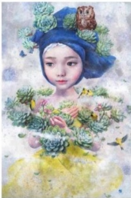
Blue Wish 3 / 90.9 X 60.6 cm / Eastern Watercolor, Acrylic on Hanji / 2016

서승은 작가는 한국화 화가로 한지의 특성을 살려낸 특유의 채색 방식과 함께 세계 최초로 '다육식물 소녀'라는 창의적인 소재를 통해서 이국적 화풍으로 자신만의 초현실주의적 세상을 보여주고 있다. 다육식물들은 내적 강인함과 고귀함을 상징하고, 가녀린 소녀의 모습은 인간의 내면 깊숙이 존재하는 외로움과 나약함을 밖으로 끄집어낸 시각적인 형태물이다. 작가가 이런 다육식물의 내적 강인함을 가녀린 소녀에게 가미시킨 것은 각박한 현대 사회를 살아가며 삶에 지친 이들에게 어떤 어려움이 찾아와도 인내하고, 노력하면 언젠가는 꽃을 피우고, 열매를 맺을 수 있음을 말해주기 위함이다.