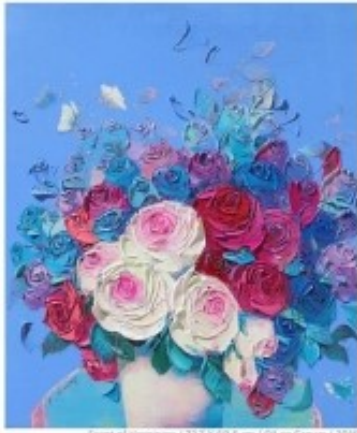
Scents of Happiness / 72.7 X 60.4 cm / Oil on Canvas / 2016