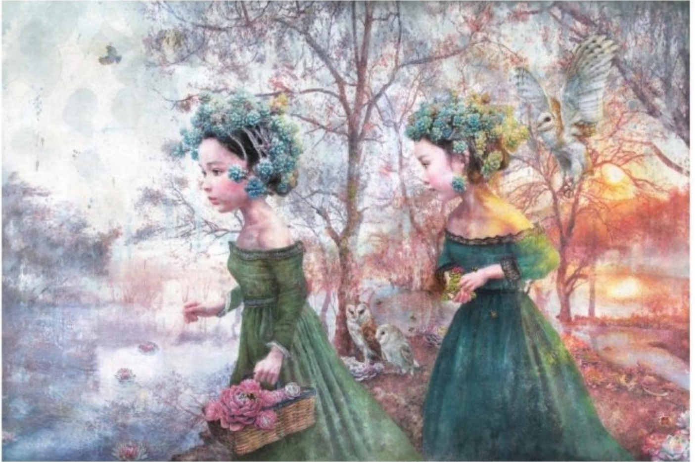
Picnic / 102.0 X 152.0 cm / Eastern Watercolor, Acrylic on Hanji / 2016