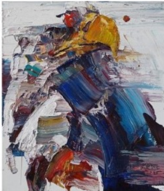
Wild aura 2015 eagle 008 / 53.0 X 45.5 cm / Oil on Canvas / 2015