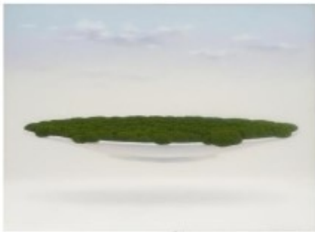
양종용 / 33.0 X 72.7 cm / Oil on Canvas / 2016

작품 속 인물이나 동물에 형태뿐만 아니라 재료의 종류나 그것을 사용하는 기법에서도 자유로운 방식을 보인다. 말만인물과는 다른 시각으로 눈도 코도 혀를 써를 자유스럽게 표현하는 것이 가장 큰 특징이자 장점이이다.