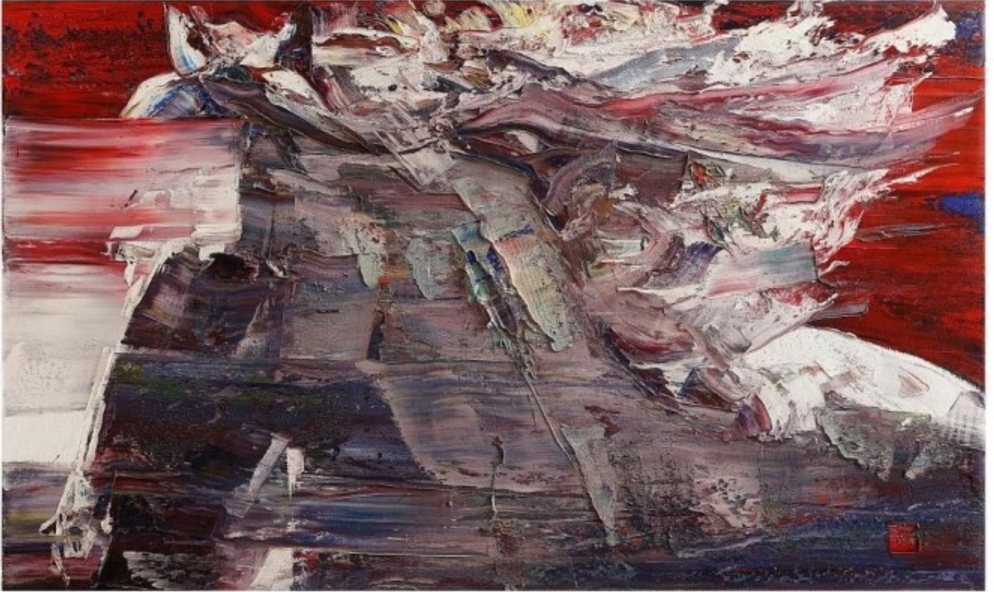
wild aura 2015 horse 017 / 162.2 X 112.1 cm / Oil on Canvas / 2015