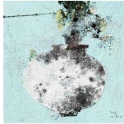
나진기 / 60.1 X 65.1 cm / Mixed media / 2016

오랫동안 나이프 작업으로 미디어에트를 살린 그녀의 작품들은 생명력 넘치는 생동감과 함께 결코 시들지 않는 모습으로 영혼의 향기를 끊임이 끊기는 아름다움이 보는 이를 하여금 행복하게 만든다.