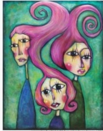
정현희 / 72.7 X 92.3cm / Acrylic on Canvas / 2016

작가는 세상을 살아가는 자신과 또 다른 사람들이 세상을 바라보고 사는 모습을 다양한 형태와 방향감, 색감으로 여러 감성을 담은 '바라보개'를 표현하고 있다. 따뜻한 느낌의 동화같은 배경에 놓여져 있는 별안 사과가 관객의 눈을 통해서 무언가를 보여주면서 관객의 마음 속으로 자신의 감정을 전해주는 힘을 느낄 수 있다.