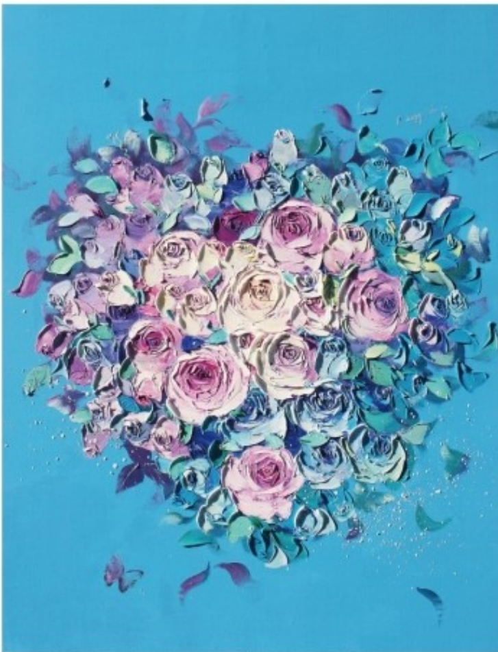
Scent of Happiness / 116.8 X 91.0 cm / Oil on Canvas / 2015

강정주 작가는 캔버스라는 평면 위에 새로운 생명을 탄생시키기 위해 시간과 공간을 초월해 여러가지 꽃들을 담아내고 있다.단순히 아름다운 꽃을 그리는 작업이 아닌, 행복의 마음을 담아 전해주는 강정주 작가의 작품에는 아름다운 향기가 있다.