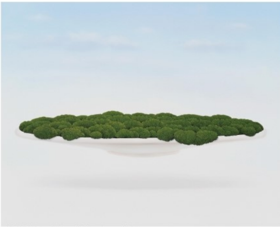
그릇이끼 / 72.7 X 90.9 cm / Oil on Canvas / 2015

2011 강원미술대전 대상 대한민국미술대전 비구상 부문 입선 2010 단원미술대전 특선 강원미술대전 우수상