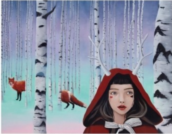
Enchanted forest / 91.0 X 116.8 cm / Oil on Canvas / 2015