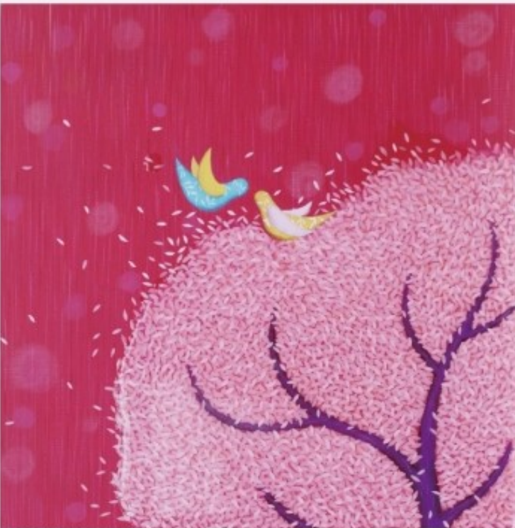
Leaf story / 31.8 X 31.8 cm / Acrylic on Canvas / 2015

김선영 작가의 작품은 동물 혹은 나무가 모티브가 되고 있다. 에폭시 작업을 통해서 작은 나뭇잎의 겹침과 겹침을 만들어 평면 회화에 입체적인 풍성함을 안겨다 준다.