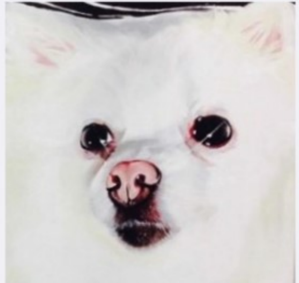
I miss you / 25.0 X 25.0 cm / Oil on Canvas / 2015