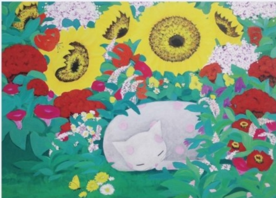
기억의 정원 / 53.0 X 72.7 cm / 장지에 혼합재료 / 2014

대구시 미술대전 한국화부문 우수상 대한민국 한국화대전 우수상 대한민국 신조형 미술대전 대상 영남 미술대전 최우수상 대한민국 현대여성 미술대전 대구광역시장상