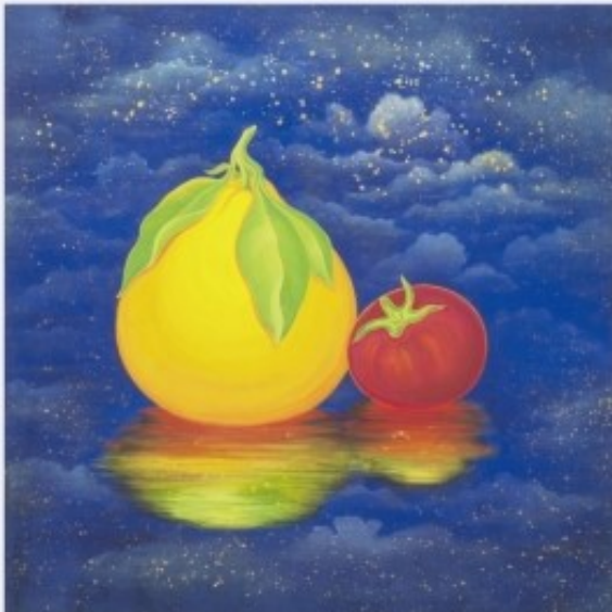
Fruits Paradise / 50.0 X 50.0 cm / 비단에 채색, 자개 / 2015