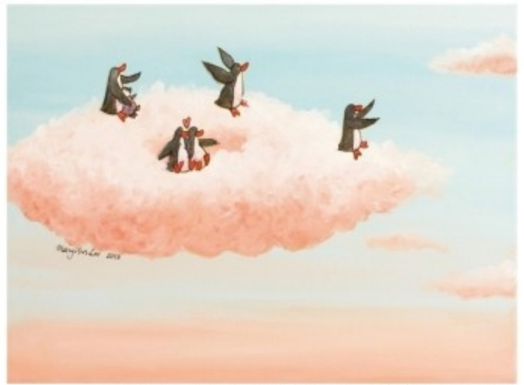
Towards a New Sky / 30.5 X 40.6 cm / Acrylic on Canvas / 2013