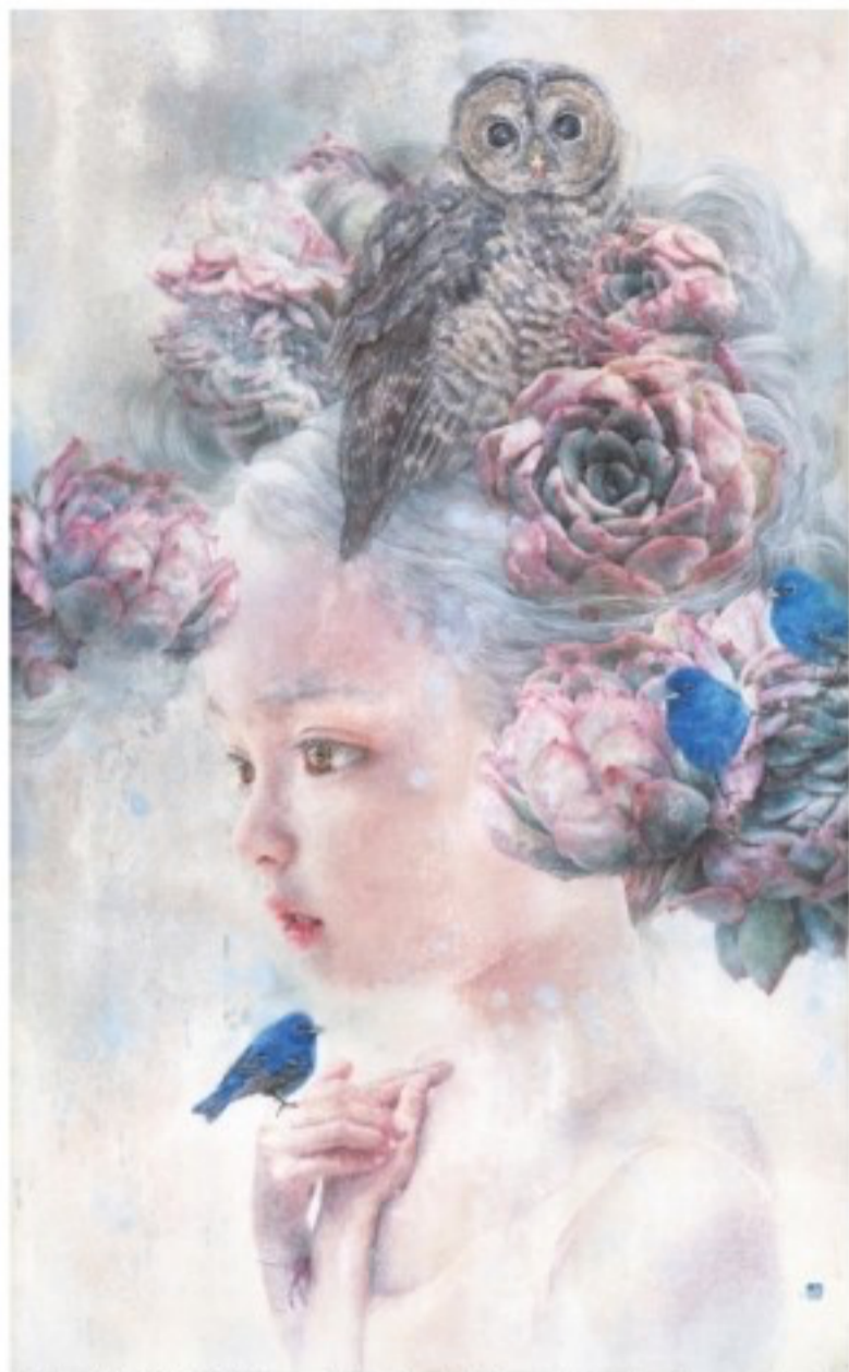
Blue Wish / 80.0 X 48.0 cm / Eastern Watercolor, Acrylic on Hanji / 2015

2014 신라미술대전 특별상 한국문화미술대전 특선 대한민국 서예미술대전 특선