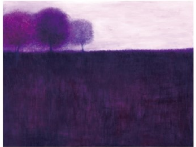
녹턴 1521 / 41.0 X 53.0 cm / Oil on Canvas / 2015