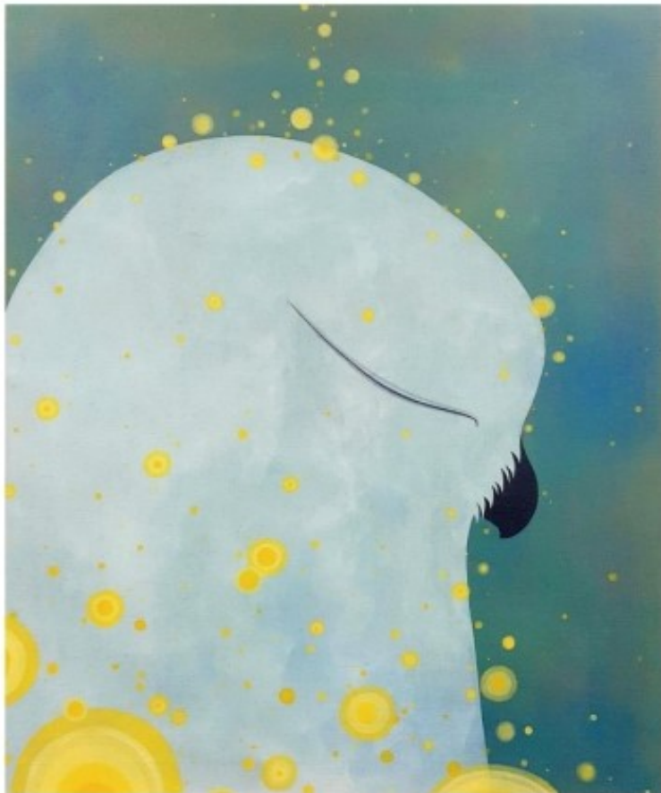
healing / 72.7 X 60.6 cm / 광목천에 아크릴 채색 / 2015

늑대를 그리는 화가로 잘 알려진 탁노 작가는 야생의 기운을 그대로 화폭에 담고 있는 추상적 표현주의 화가이다. 간결하고, 강한 터치와 색감만으로 모든 것을 표현하는 탁노 작가는 야생의 기질을 가진 동물들을 통해서 인간이 내면에 가지고 있는 본능적 야성과 자유로움을 일깨워주고자 한다. 늑대 뿐만 아니라 독수리, 야생마, 황송 등등... 본연의 야성을 분출하는 강렬한 모습을 자신만의 화법으로 표현해내고 있다. 최근 2015 아트부산에서 100호 청마 작품과 독수리 작품을 통해서 미술 애호가들로부터 크게 주목 받았고, 그의 작품 세계에 많은 관심이 쏟아지고 있다.