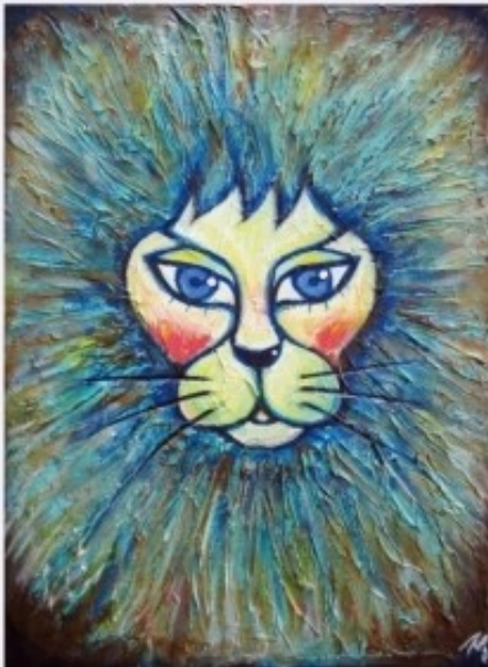
사자 / 33.4 X 24.2 cm / Acrylic on Canvas / 2015