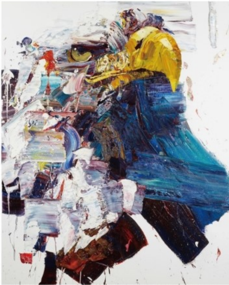
Wild auras 2015 eagle 011 / 162.2 X 130.3 cm / Oil on Canvas / 2015